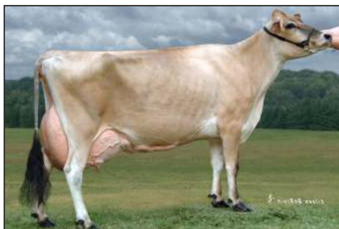
Monica - babka Macarthur