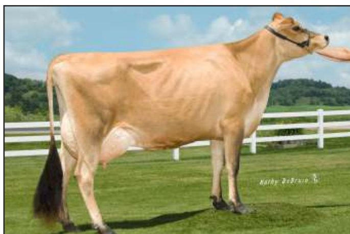
Marvel - matka Macarthur