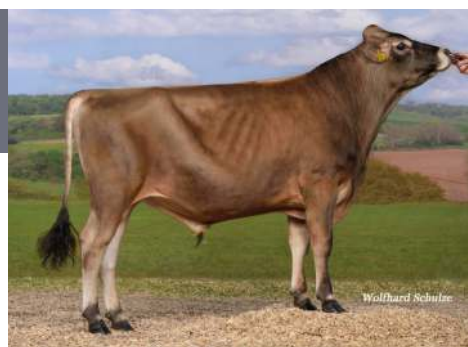
Wybitny buhaj bezrożny • Sprawdzona linia żeńska • Buhaj kompletny

DEU 001406414157 aAa: 156432 ur. 01.02.2021