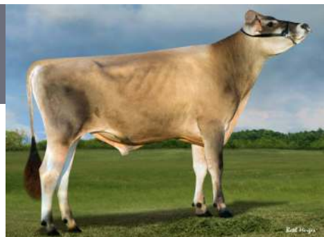
Linia żeńska EX • Wspaniałe wymię • Płodność córek

USA 003127607529 aAa: 423561 ur. 17.03.2016